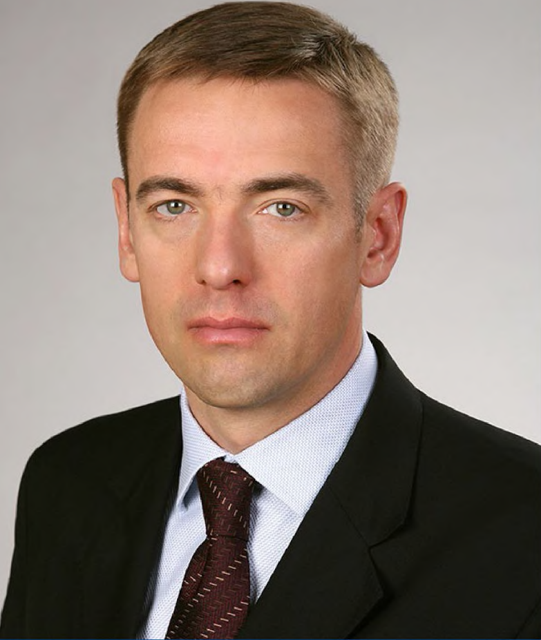
В.Л. Евтухов – статс-секретарь – заместитель Министра промышленности и торговли Российской Федерации